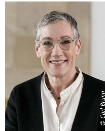
Oberbürgermeisterin Sibylle Keupen