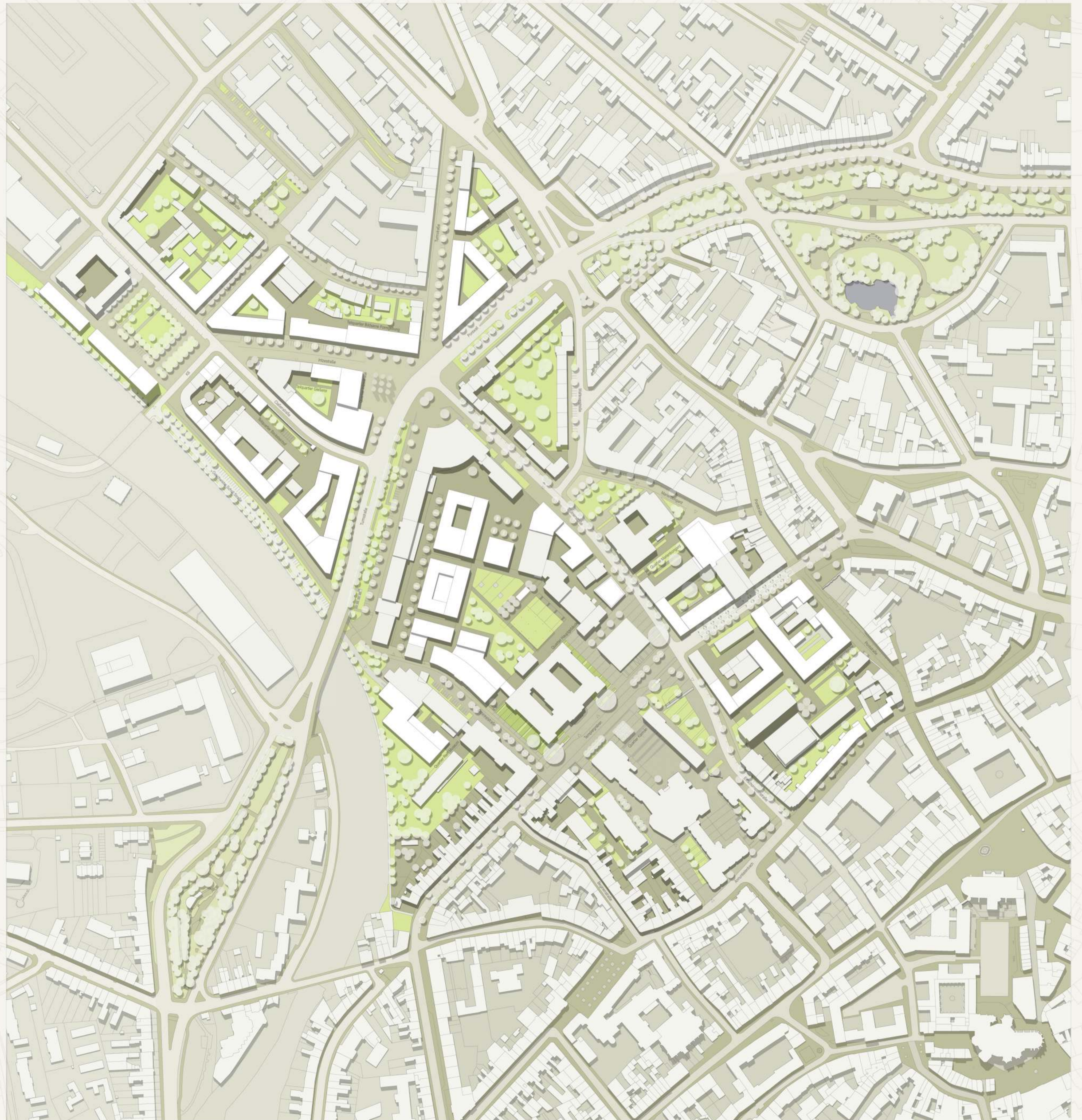
Lageplan M. 1:2.000