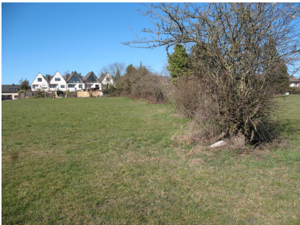
Östlich des Sanddornweges endet das Plangebiet an einer Hecke. Diese sollte als Abgrenzung zum verbleibenden Landschaftsraum erhalten bleiben.