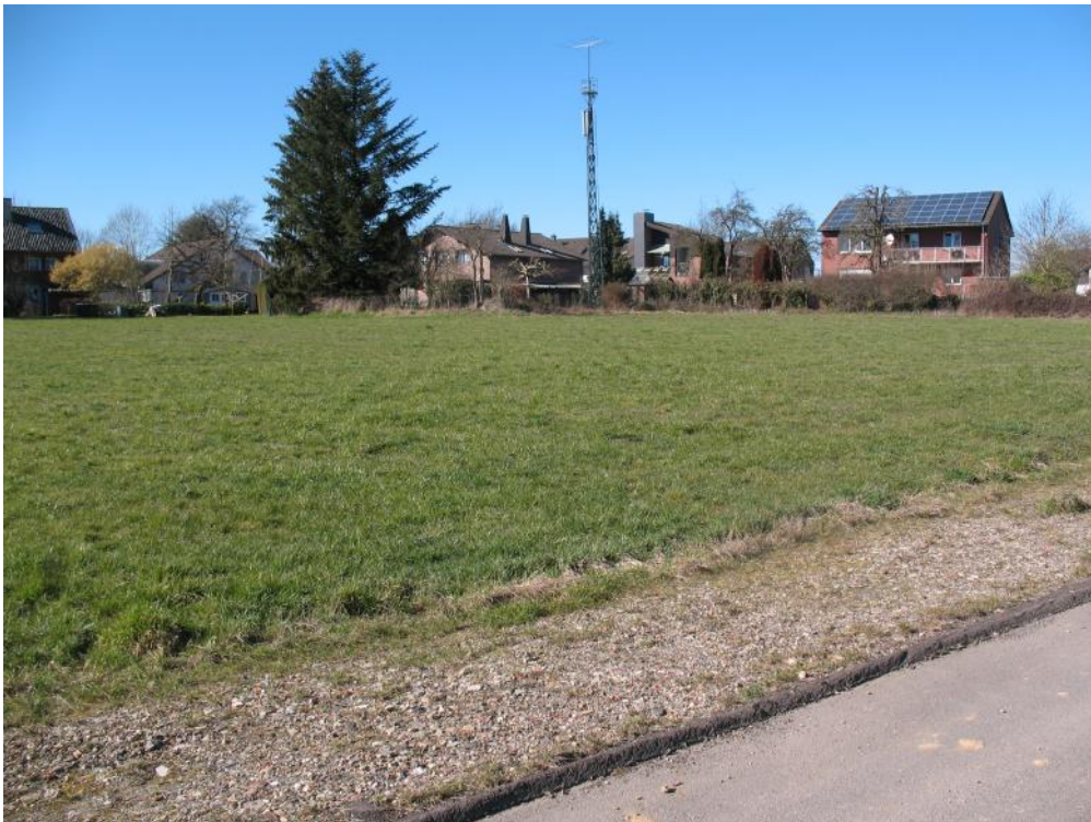
Durch den Sanddornweg (vorne) werden die Wiesen hinter der Bebauung an der Raafstraße (hinten) erschlossen. (alle Fotos vom 27.2.2019)