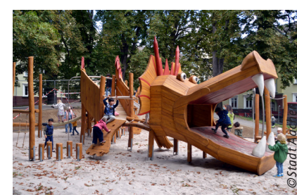
(3) Spielplatz Siegmundstraße