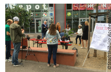
(5) Roter Tisch