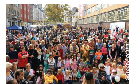
(14) Goldene Zeiten