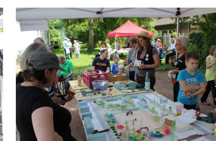
(19) Sportfest Kirschbäumchen