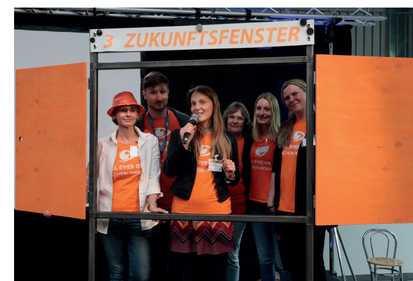
1. Überführung der Arbeit des Stadtteilbüros in ein städtisches Quartiersmanagement

des Stadtteilfonds als städtische finanzielle Unterstützungen kleinerer Projektideen aus dem Stadtteil stellt zukünftig eine wichtige Aufgabe der Stadtteilkonferenz nach Auslauf des Förderprogramms Soziale Stadt Aachen-Nord dar. Der Umbau des alten Straßenbahn-DEPOTS zu einem soziokulturellen Stadtteilzentrum konnte 2016 abgeschlossen und Anfang 2017 die Türen endlich geöffnet werden. Nun gilt es, das DEPOT auch nach Auslauf der Förderprogramms in seiner Funktion als Treffpunkt im Quartier weiter auszubauen und zu stärken.