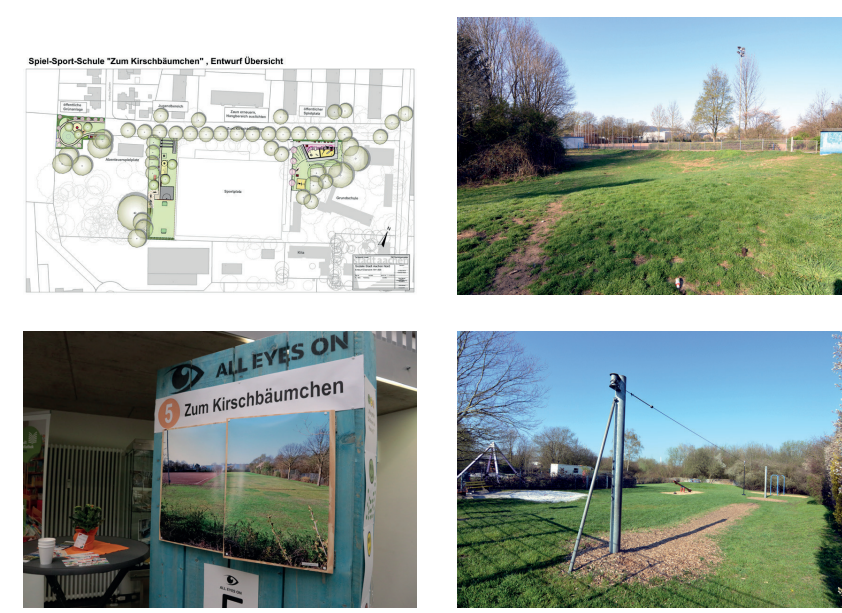
1. © Stadt Aachen / 2. © Stadt Aachen / 3. © Thomas Langen / 4. © Stadt Aachen