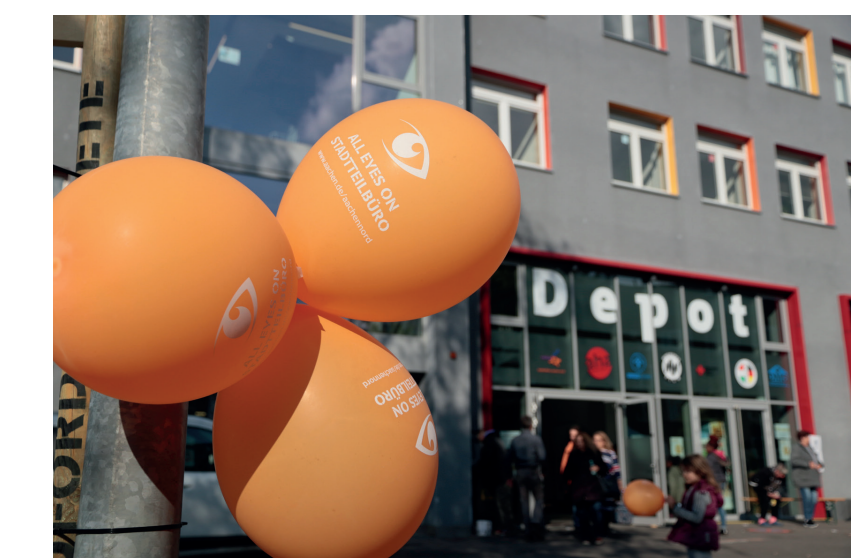
2. Weitere Stärkung des DEPOTS als Treffpunkt im Quartier