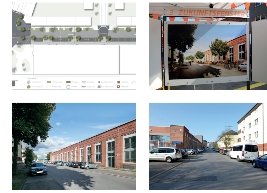
1. © Stadt Aachen / 2. © Thomas Langen / 3. 4. 4. © Stadt Aachen