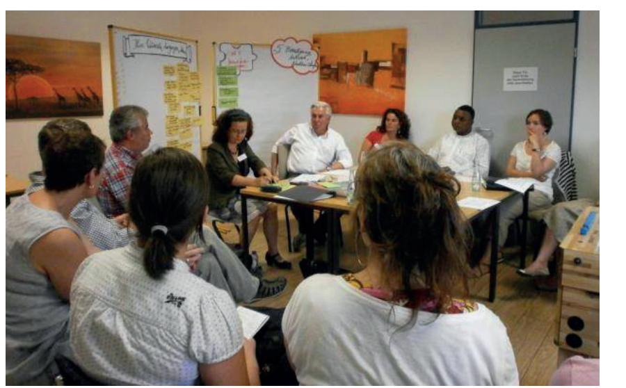
3. Fortsetzung der Arbeit der Stadtteilkonferenz