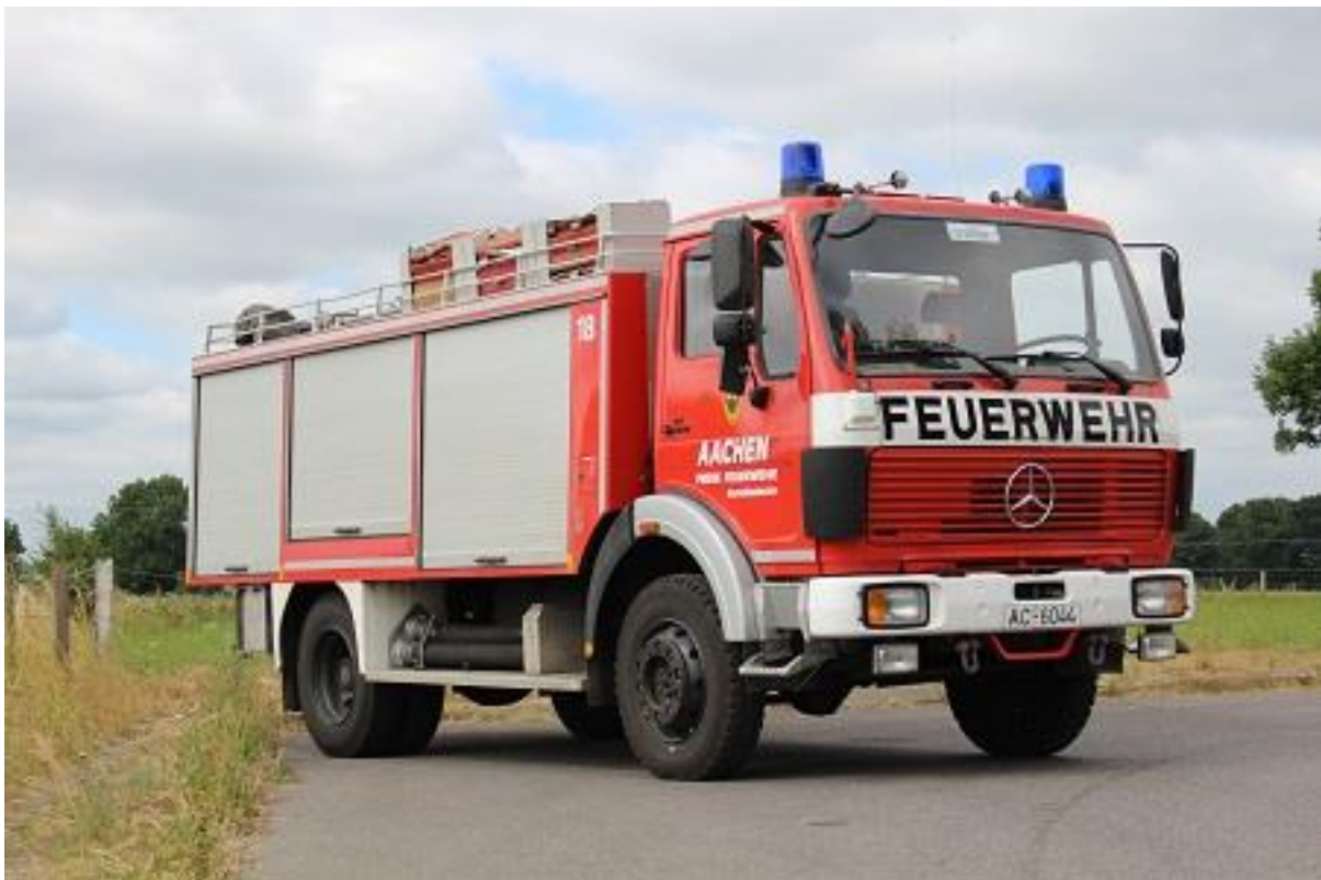
Schlauchwagen SW 2000-Tr

Nach 36 treuen Dienstjahren, wurde 2020 der Schlauchwagen SW 2000-Tr