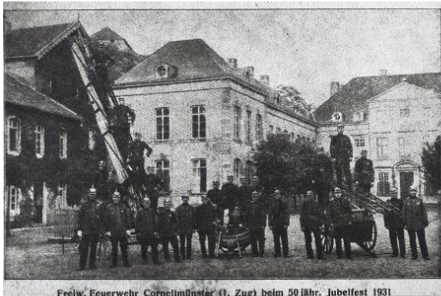
Freiw. Feuerwehr Cornelimünster (1. Zug) beim 50 jähr. Jubelfest 1931 Feuerwehr 50 Jahre 1931