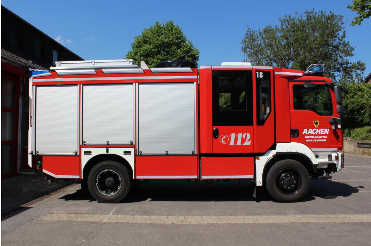
Löschgruppenfahrzeug LF 20Kats

Nach 36 treuen Dienstjahren, wurde 2020 der Schlauchwagen SW 2000-Tr