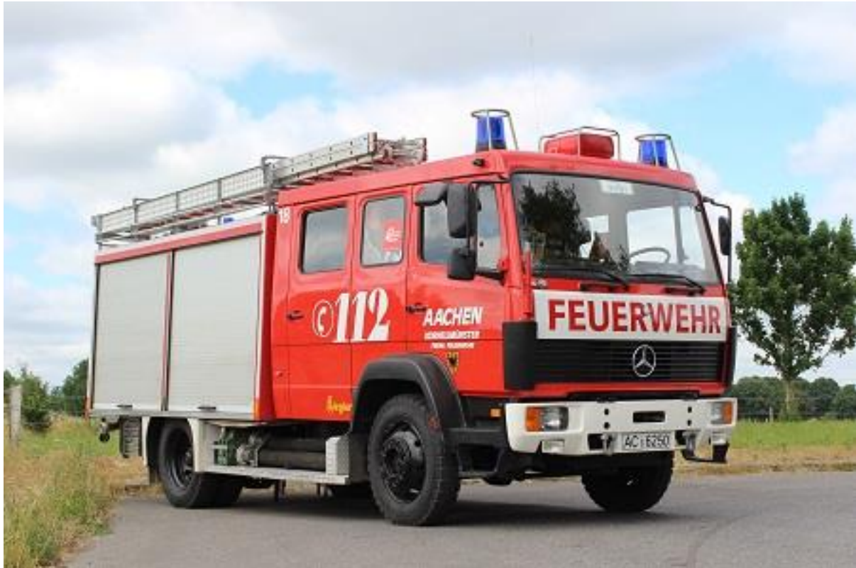
Löschgruppenfahrzeug LF 16/12

Im Jahre 2018 wurde das Löschgruppenfahrzeug LF 16/12