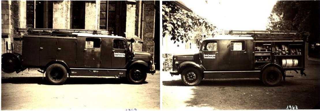
LF 8, 1963

Erfreulich war die Feststellung, dass sich immer mehr junge Leute für den Feuerwehrdienst interessieren, so dass die Wehr unter keinerlei Nachwuchssorgen zu leiden hatte.