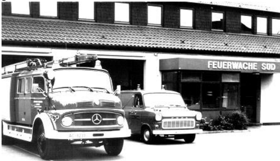
Fahrzeuge ab 1972

In dem gleichen Jahr sind auch zwei alte Fahrzeuge durch modernere ersetzt worden. Das inzwischen 23 Jahre alte LF 8 wurde durch ein Löschgruppenfahrzeug 16 und der VW Bus durch einen Ford Transit ersetzt. Der Ford Transit erhielt eine Bestückung, die ihn besonders für technische Hilfeleistungen und Ölalarme unersetzlich machte.