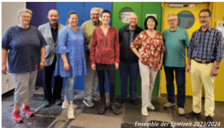
Ensemble der Spielzeit 2023/2024