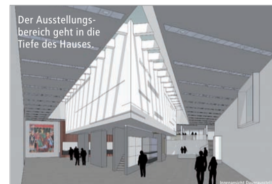
Der Ausstellungsbereich geht in die Tiefe des Hauses.