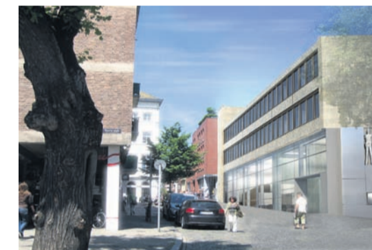
Der neue Bürgerservice mit Eingang an der Johannes-Paul II.-Straße.