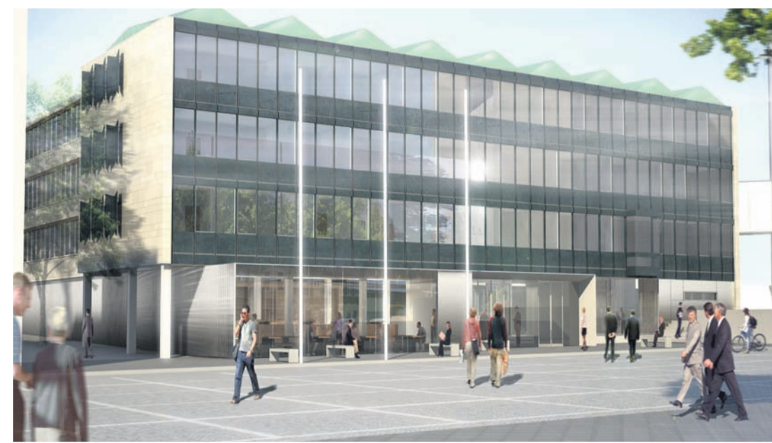
Die Treppenstufen fallen weg. Der Eingangsbereich des denkmalgeschützten Gebäudes wird offener gestaltet