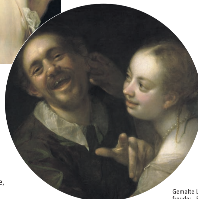
Gemalte Lebensfreude: „Bacchus, Ceres und Amor“, das Titelmotiv der Ausstellung, und das Bild „Junges Paar mit Börse“, ein Selbstporträt mit Damenbegleitung.

Hans von Aachens Kunst ist eine einzigartige Melange der europäischen Malerei zur Zeit der späten Renaissance: Italienische Extravaganz trifft auf flämischen Realismus. Seine Werke sind erfüllt von eleganter Sinnlichkeit. Pure Lebensfreude würde der Rheinländer dies nennen. Hans von Aachen liebte seine hiesigen Wurzeln. Der von ihm gewählte Nachname spricht Bände. Willkommen zu Hause, Hans!