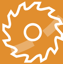
Zerkleinerung grobe Zerkleinerung für die Müllverbrennungsanlage