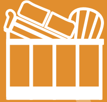
Sammlung am Recyclinghof