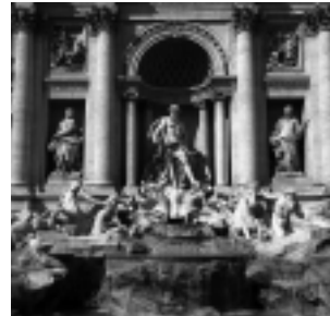
TREVI-BRUNNEN IN ROM

ITALIEN/FRANKREICH, 1960, S/W., DEUTSCHE FASSUNG VORTRAGSSAAL IM SUERMONDT-LUDWIG-MUSEUM, WILHELMSTR. 18, AACHEN