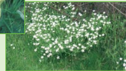
Große Sternmiere