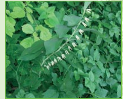
Vielblütige Weißwurz