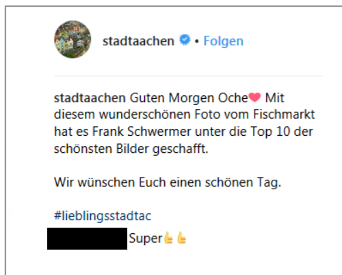
links: Social Media Post der Gewinnerbilder rechts: Ausstellung im Straßenraum