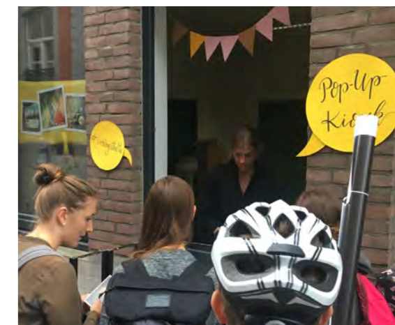
oben: Facebooktitelbild zur Aktion links: Ankündigung bei Facebook rechts: Großer Andrang am Haus Löwenstein