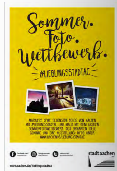
Citylight-Poster riefen zur Teilnahme auf.

des Centre Charlemagne ausgestellt. Vorausgegangen war dem Wettbewerb eine eigene Instagram-Kampagne der Stadt Aachen, bei der die täglichen „Guten Morgen, Lieblingsstadt“-Fotos die Citylights der Stadt schmückten. Den Ball an die Bürgerinnen und Bürger weiterzugeben, war eine konsequente und erfreulich erfolgreich verlaufende Fortführung der Kampagne, die ihre eigene Dynamik entwickelt hat. Nach dem Wettbewerb fanden sich im Herbst 2017 unter #lieblingsstadtac schon mehr als 4.000 Beiträge. Bis 2019 ist die Zahl auf 12.500 gestiegen.