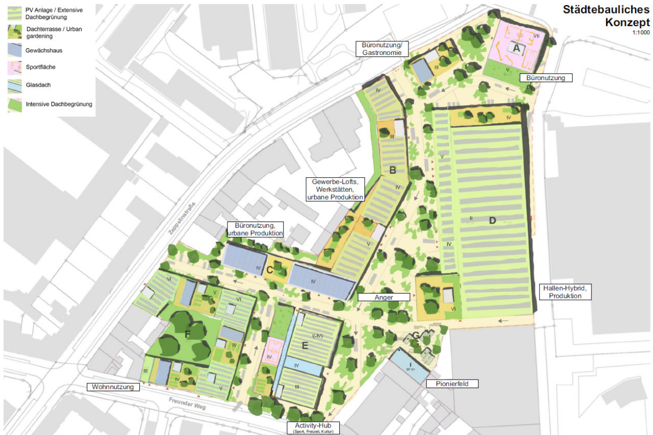
Abbildung 4: Städtebauliches Konzept mit Freiraumgestaltung, Molestina Architekten und Studio grün grau Landschaftsarchitekten

Einen Höhenakzent im gesamten Plangebiet bildet der Gebäudekörper A am nördlichen Eingang mit sieben Geschossen und einer baulichen Höhe von etwa 30,0 m. Im weiteren Verfahren wird noch untersucht, ob auch eine noch höhere Bebauung an dieser Stelle wirtschaftlich umsetzbar wäre. Am Eisenbahnweg, unmittelbar gegenüber der Einmündung Philipsstraße, ist dieser Akzent gut sichtbar und wirkt als Adressschild in Richtung des Eisenbahnweges und des nördlich angrenzenden industriell geprägten Raumes, der ebenfalls zukünftig neu entwickelt werden soll. Darüber hinaus soll dieser vertikal orientierte Baukörper das städtebaulich spannungsreiche Pendant zur gegenüberliegenden, denkmalgeschützten Strang-Halle bilden, die in ihrer Substanz eine eher horizontale Ausrichtung hat. Ein weiterer baulicher Sonderbaukörper zur Gestaltung des nördlichen Eingangs wurde dagegen als kleinerer (dreigeschossiger) Baustein (14,9 m Höhe) im Übergang zu dem nördlich angrenzenden Fußweg und Bolzplatz mit Baumbestand vorgesehen. Dieser gliedert den hier entstehenden Platzraum und bildet einen Schlussstein für den innenliegenden Freiraum des Gebietes.