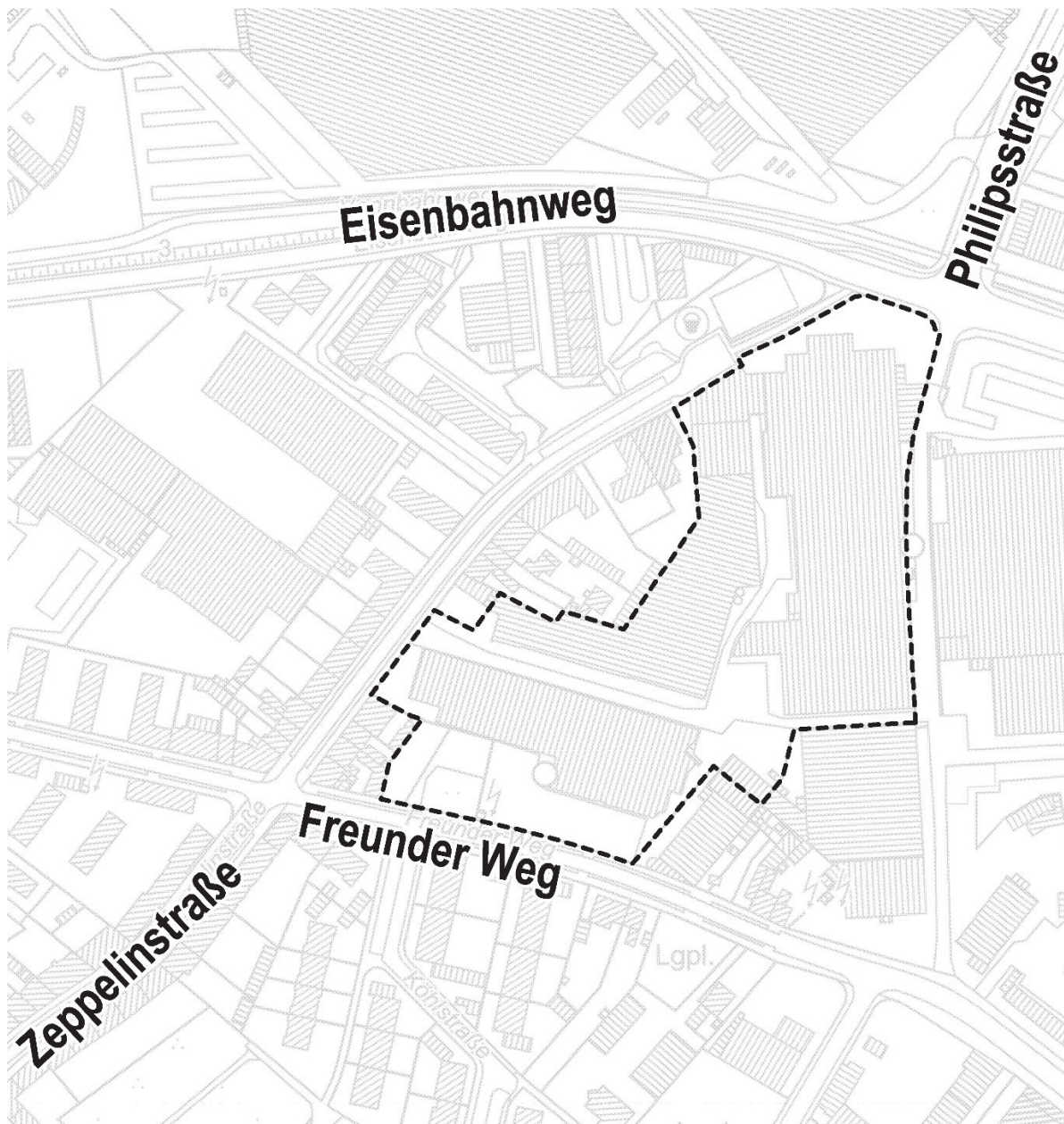
Lage des Plangebietes

im Stadtbezirk Aachen-Mitte zur Programmberatung