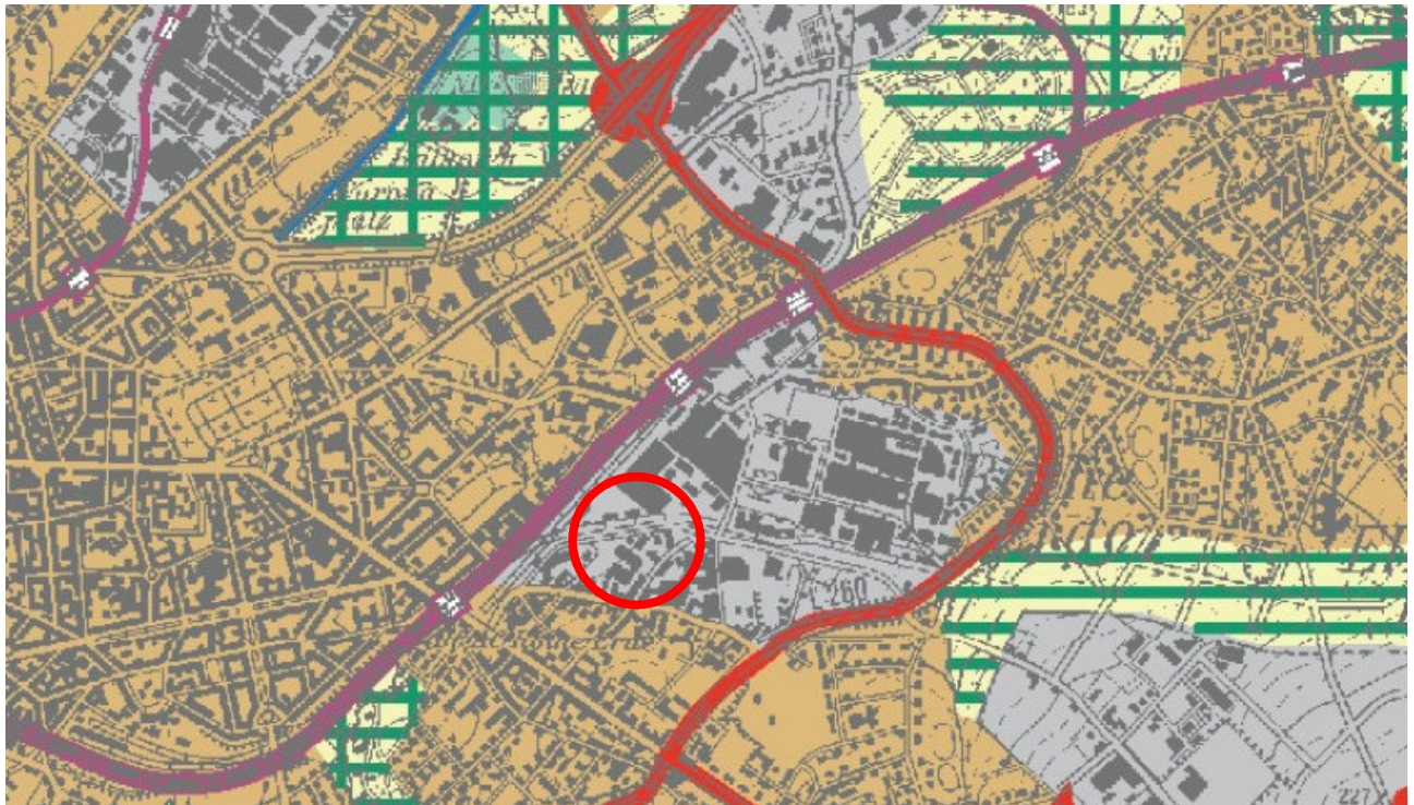
Abbildung 2: Regionalplan Region Aachen (Stand 2003)