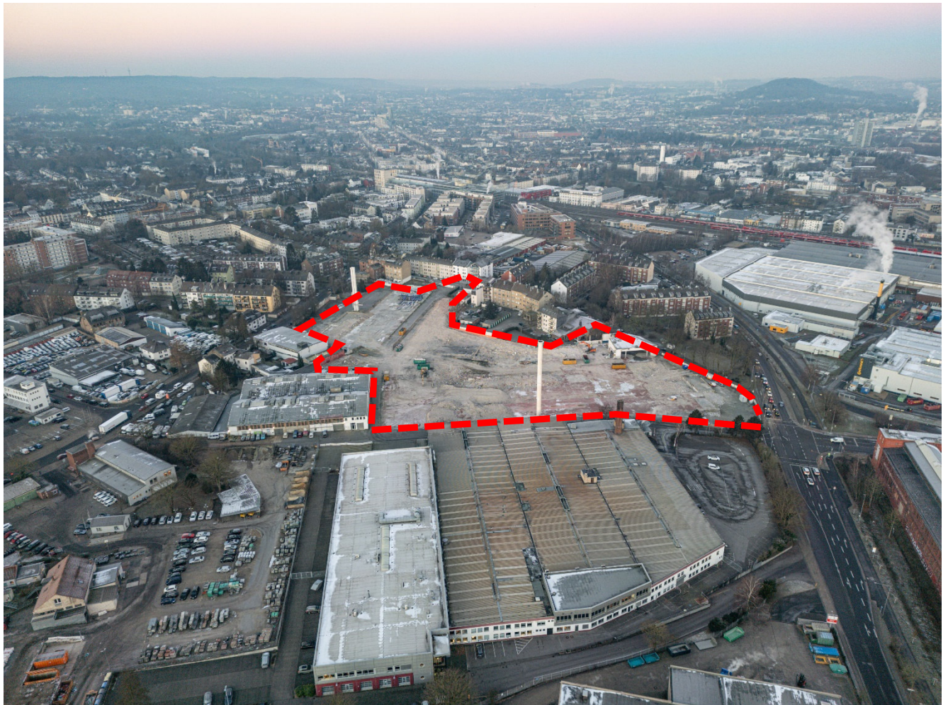
Abbildung 1: Luftbild Plangebiet von Osten (Hutchinson-Areal)