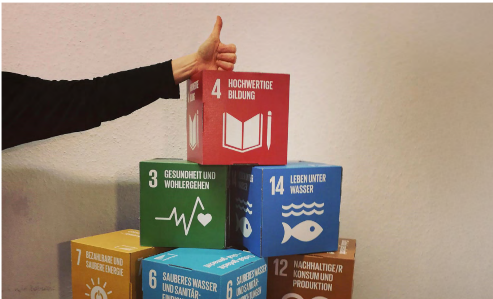
© Stadt Aachen / Klara Kauhausen