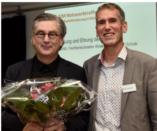
Dank an die Architektengruppe K2 für die Unterstützung von „Wie funktioniert die Schule?“