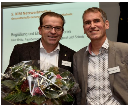
Dank an den Lionsclub Aquisgranum für die Förderung der Mehrsprachigkeit in Aachen Nord

Und Dank an die LuScheinStiftung für die Förderung der Mehrsprachigkeit in Aachen Nord, die leider nicht am 5. Netzwerktreffen teilnehmen konnte.