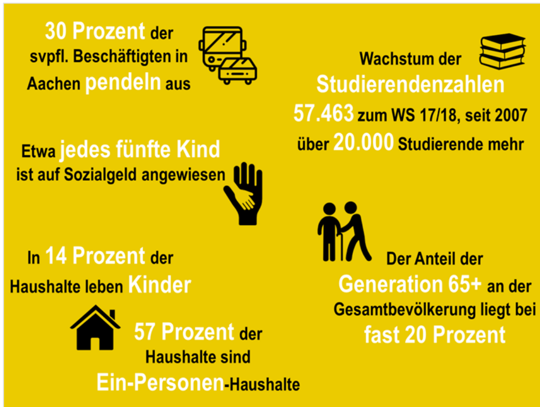
Abb.: Kerndaten zu Aachens Sozialentwicklung

sundheit, sprachliche Entwicklung, soziale Kontakte) haben Auswirkungen auf die gesamte weitere Biographie. Kinderarmut in all ihren Facetten ist in Aachen genauso ein Thema, wie verfestigte Armutsstrukturen entlang familiärer Biographien (Armutsspiralen), Langzeitarbeitslosigkeit und Altersarmut. Die andere Seite des Wandels hin zur Dienstleistungsgesellschaft bringt eben auch eine Zunahme von Niedriglohnjobs und Befristungen mit. Ein Arbeitsplatz garantiert heute nicht unbedingt ein „gutes“ Einkommen (Phänomen der sog. working poor).