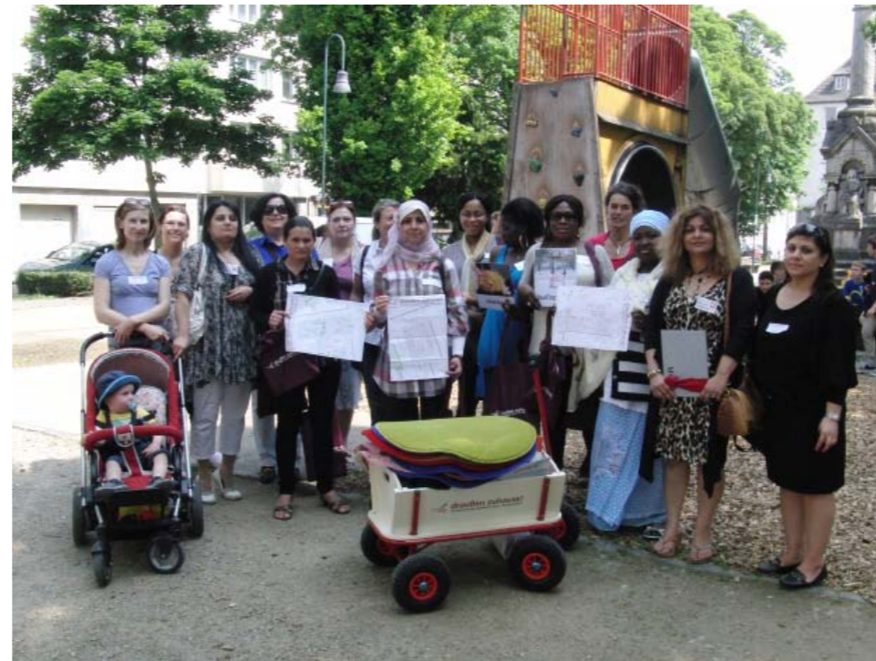
Stadtteilmütter mit Migrationshintergrund