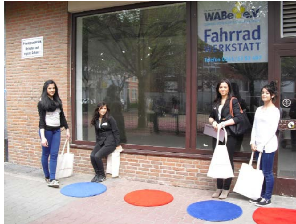
Jugendliche weiblich, Aretzschule