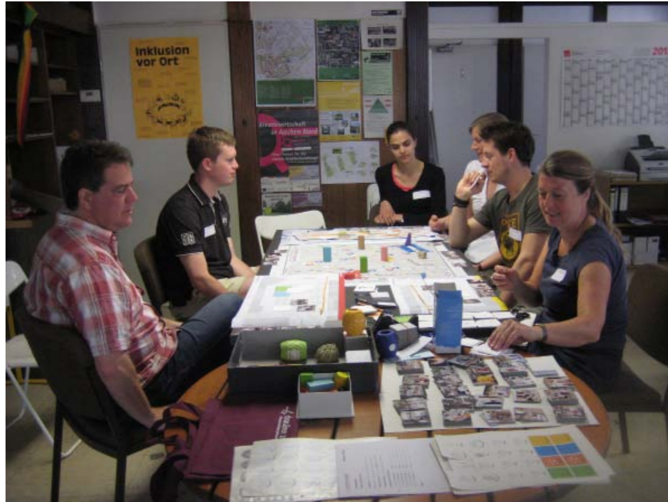
Beginn Spielrunde mit Studenten