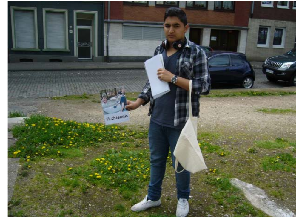
Jugendliche männlich, Aretzschule