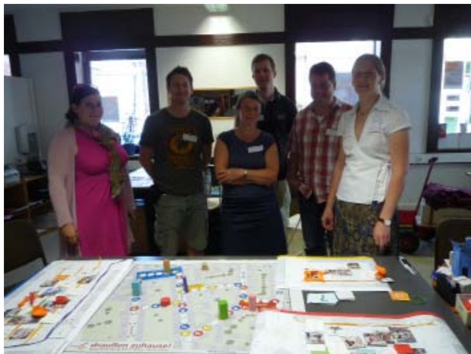
Spiel mit Studentengruppe