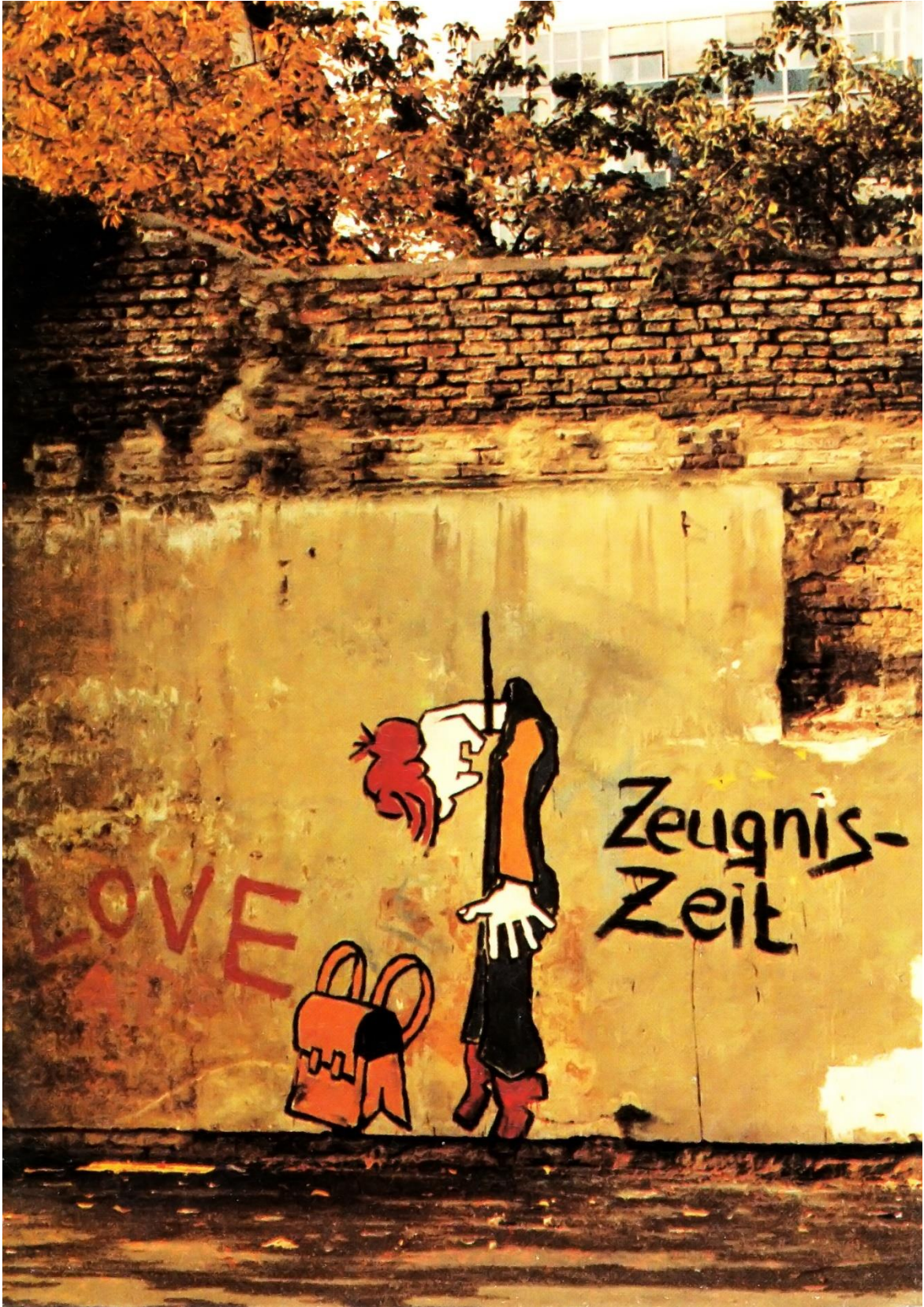
Abb. 1: Klaus Paier: Zeugniszeit (1978)