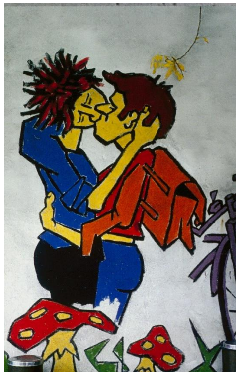
Abb. 7: Klaus Paier: Liebespaar (1978)