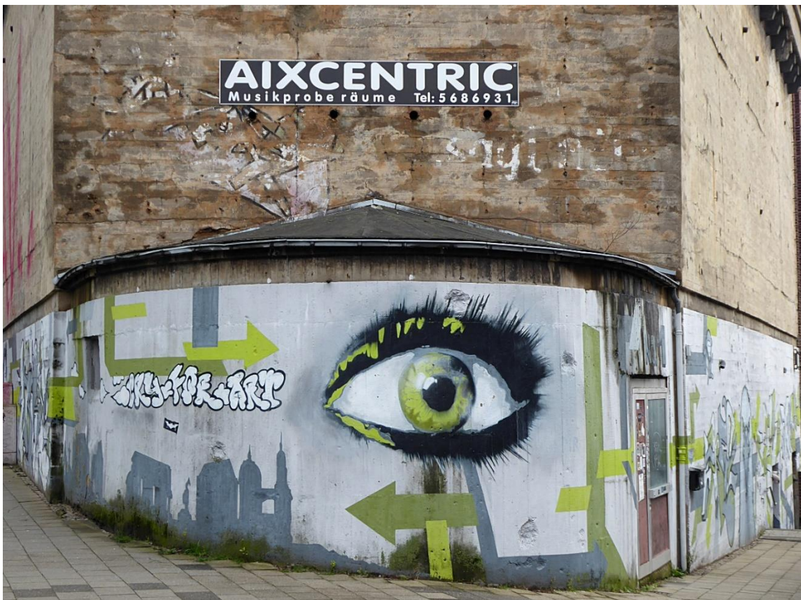
Abb. 11: Bunker Saarstraße am 3.2.2018