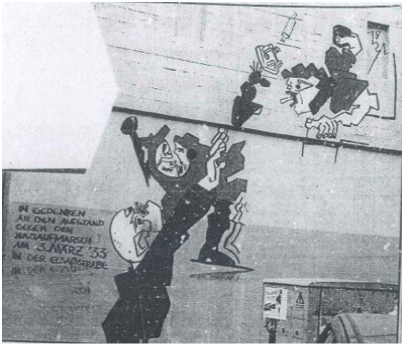
Abb. 14: Klaus Paier: Schlacht in der Elsassstraße (1989), Zustand 1990