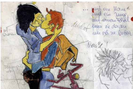
Abb. 6: Klaus Paier: Liebespaar, Vorzeichnung (1978)