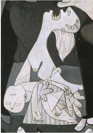
Abb. 2: Pablo Picasso: Guernica, 1937 (Detail)

Abb. 1 befindet sich zwischen Inhaltsverzeichnis und Einleitung.