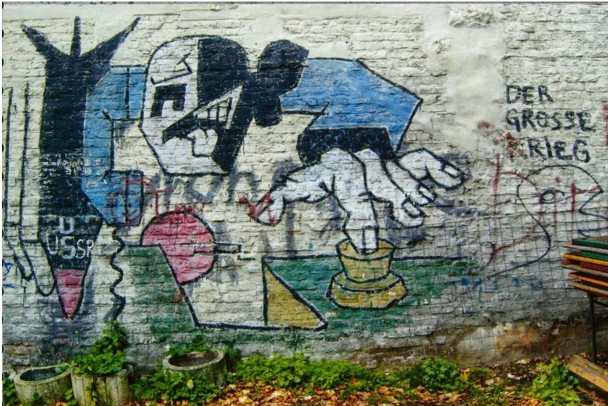
Abb. 12: Klaus Paier: Der große Krieg findet statt (1980)