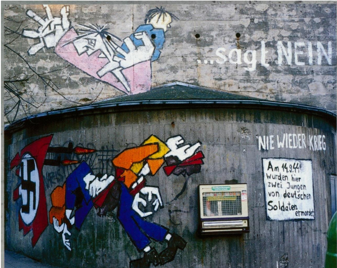
Abb. 9: Klaus Paier: NIE WIEDER KRIEG ... sagt NEIN (1982 + 1983)