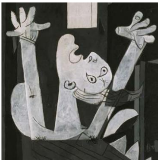
Abb. 3: Pablo Picasso: Guernica, 1937 (Detail)