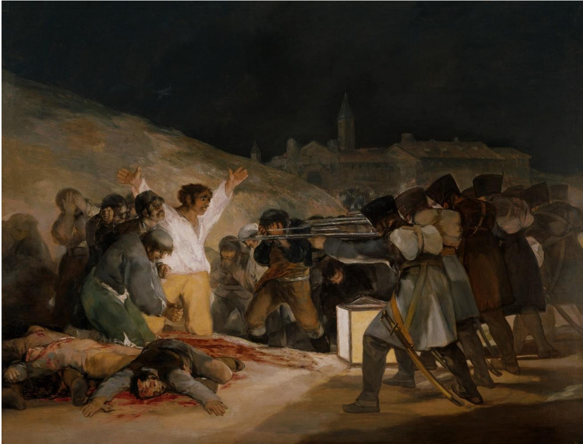
Abb. 10: Francisco de Goya y Lucientes: El tres de mayo de 1808 en Madrid (1814)