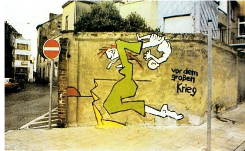
Abb. 4: Klaus Paier: Vor dem großen Krieg (1978?)