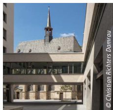
Antoniterquartier Köln trint + kreuder d.n.a architekten, Köln