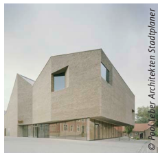
Kulturzentrum Vreden Leber Pool Architekten Stadtplaner BDA, München