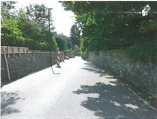
Blick von Nordosten, entlang der Dorffer Straße Richtung Kornelimünster, 2016

Zusätzlich zu den abgestimmten Änderungen schlagen wir vor, auf der Höhe, hinter der Bergkirche, in den Denkmalbereich die historischen Mauern einzubeziehen, die den Weg über die Höhe zum Ort hin begleiten.