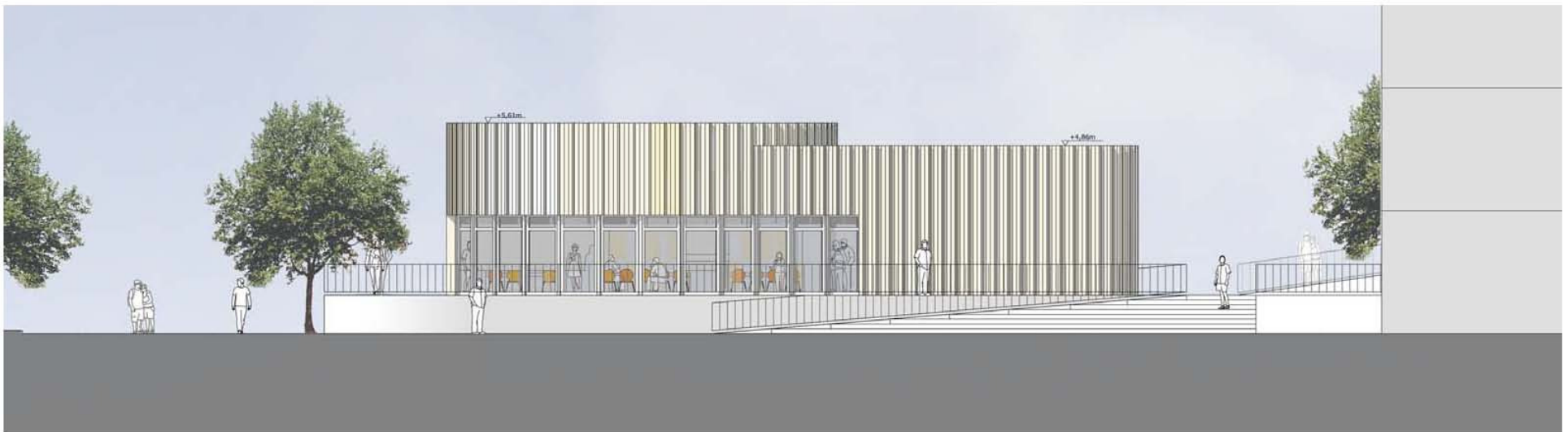
Ansicht Nord Ost