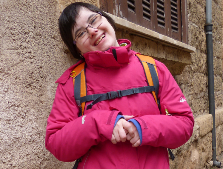
ALLE HABEN DAS RECHT IN DER MITTE DER GESELLSCHAFT ZU LEBEN.