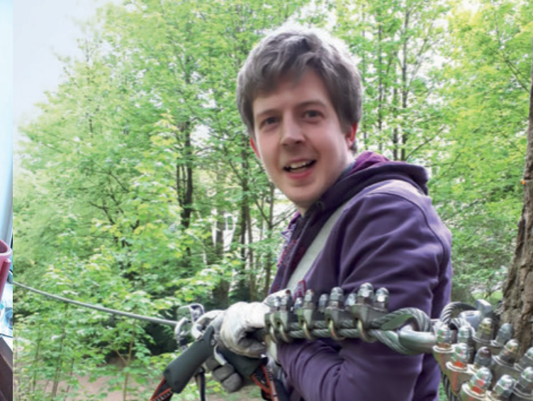
WIR FREUEN UNS AUF DAS WOHNEN IM INKLUSIVEN HAUS

Der Verein Inklusiv Wohnen Aachen e.V. realisiert ein innovatives Wohnprojekt.